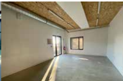
Atelier réparation de vélos de la Maison Pour Tous