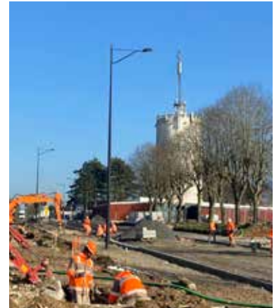
Remplacement de l'éclairage public