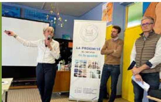
Réunion publique et consultation des habitants de mai à juin 2022.

■ Courant 2023 : Vous serez très prochainement contactés pour le bon déroulement des travaux