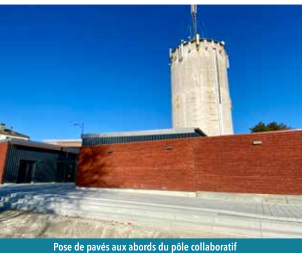
Pose de pavés aux abords du pôle collaboratif