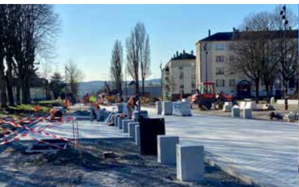
Pose de pavés du futur parvis