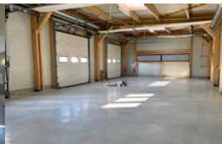
Garage de type solidaire pour la maintenance de véhicules (en recherche de partenaires)