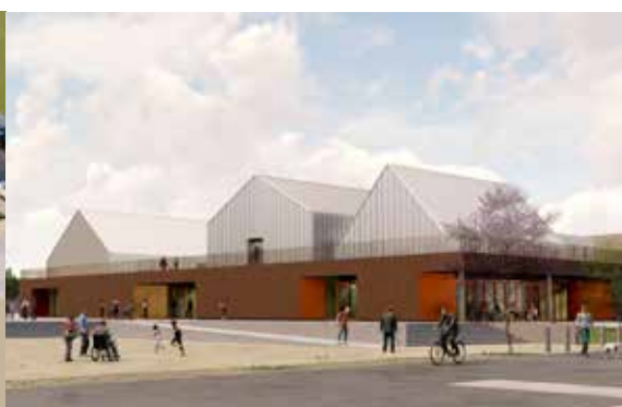
De nombreuses animations seront développées au sein du pôle, comme les activités manuelles, culturelles et sportives de la Maison Pour Tous. La maison de quartier du Soleil-Levant Bouleaux Platanes et le studio d'enregistrement Télé Baie de Somme y seront également installés.