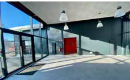
Le hall d'accueil pourra accueillir des expositions

Retrouvez la démolition de l'immeuble des Tilleuls en vidéo sur la plateforme www.telebaiedesomme.fr , ou directement en scannant ce code QR