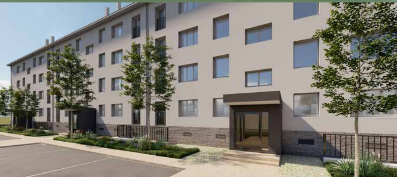
État projeté du bâtiment