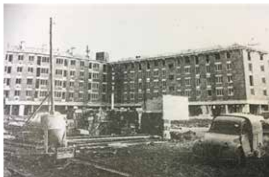
Années 60 : chantier en cours rue du Soleil-Levant 196 logements de l'Office H.L.M.

Rendez-vous à la maison du projet où une exposition avec des photos inédites vous attend !