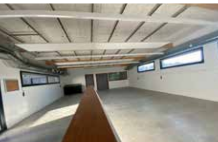
Fabrique numérique de la Maison Pour Tous avec une petite pièce dédiée à l'imprimante numérique