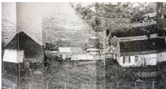
1959 : la ferme Petit entourée par un champs de violettes

Envie de découvrir l'histoire de votre quartier et voir à quoi il ressemblait dans les années 60 ?