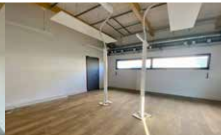
Salle multimédias de la Maison Pour Tous