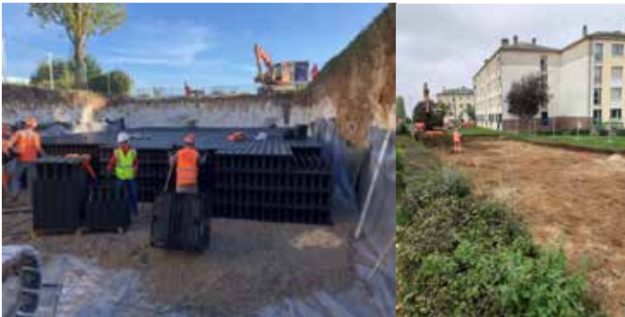
Création d'un bassin de rétention d'eau et de la plateforme du futur pôle socioculturel et sportif