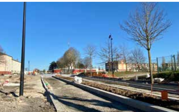
Création de bordures et d'îlots route de Doullens

Depuis janvier 2023, les travaux de la route de Doullens se poursuivent ! La réouverture de la route est prévue pour le mois d'avril 2023. En images les travaux réalisés et ceux qui sont en cours de réalisation.