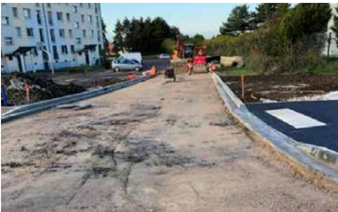
Création de l'amorce de route, rue des Pommiers