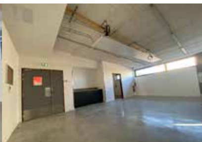
Deuxième antenne de l'association 2 ème chance dédiée à la recyclerie de meubles