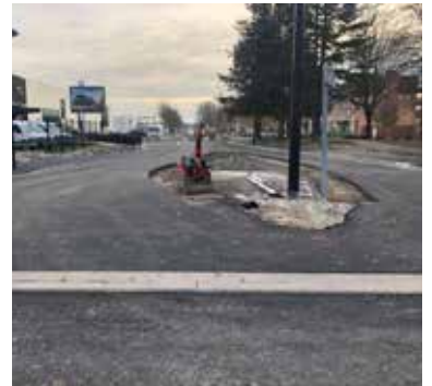
Réalisation des trottoirs aux abords du carrefour Robert Schuman