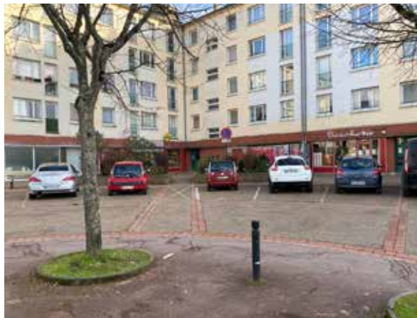
La place Chantal Leblanc et son accès actuel aux commerces

La place Chantal Leblanc sera également requalifiée. Une concertation avec les acteurs locaux sera menée au premier semestre 2023. Les travaux devraient débuter fin 2024 pour se terminer dans le même délai que la réhabilitation des logements.