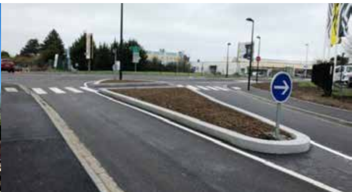
Fin de la réalisation du carrefour Robert Schuman