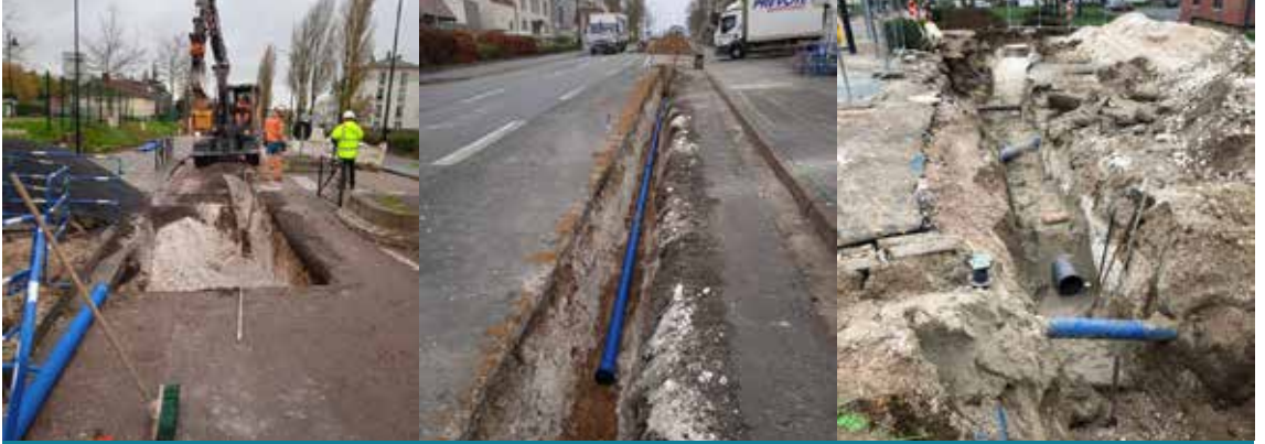
Travaux d'assainissement et de canalisations

De septembre à décembre 2022 s'est déroulée la Phase 1 des travaux de la route de Doullens. Voici en images ce qui a été réalisé.