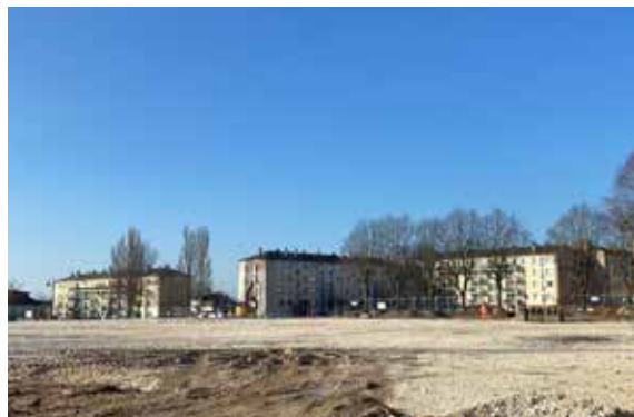
Emplacement du futur pôle socio-culturel et sportif d'une superficie de 2 000m 2

Le permis de construire du futur pôle socio-culturel et sportif a été accordé le 24 novembre dernier et les futurs usagers ont été concertés quant à l'aménagement des locaux. Les travaux devraient démarrer à l'été 2023 pour une livraison prévue fin 2024.