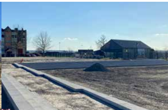
Accès au futur pôle socio-culturel et sportif