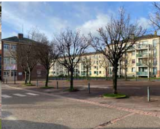
La place Chantal Leblanc telle qu'elle est aujourd'hui