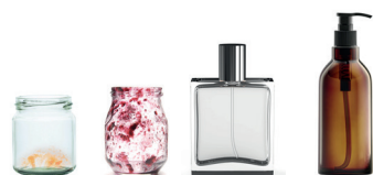
Pots, bocaux et flacons en verre